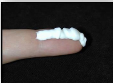
Figuur 1. Vingertopeenheid

Om te weten hoeveel zalf per lichaamsdeel nodig is, is onderstaand schema gemaakt (tabel 2). Dit schema gaat uit van de vingertop als maateenheid. Met één vingertopeenheid (VTE, figuur 1) kunt u een gebied ter grootte van beide zijden van een volwassen hand insmeren.