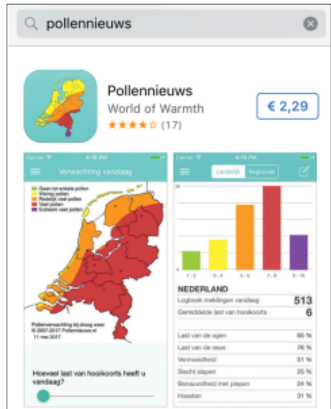
Figuur 2. Pollennieuws.