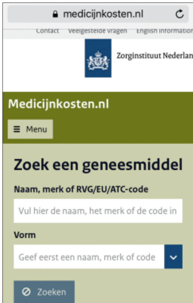
Figuur 3. Medicijnkosten.nl.

Deze app is ontwikkeld door de werkgroep Hidradenitis suppurativa (HS) van de NVDV. Met slechts enkele klikken kunt u hier de hurleyclassificatie voor een patiënt bepalen, waarbij tevens de inflammatoire component en de uitgebreidheid van HS worden meegenomen (de 'verfijnde hurleyclassificatie'). Hierbij wordt voor de betreffende hurleyclassificatie direct een behandeladvies gepresenteerd, dat gebaseerd is op recente richtlijnen. Ik gebruikte de app zelf nog niet, maar er-vaar hem als overzichtelijk en snel, en zal hem in de toekomst dan ook zeker tijdens een vol spreekuur raadplegen.