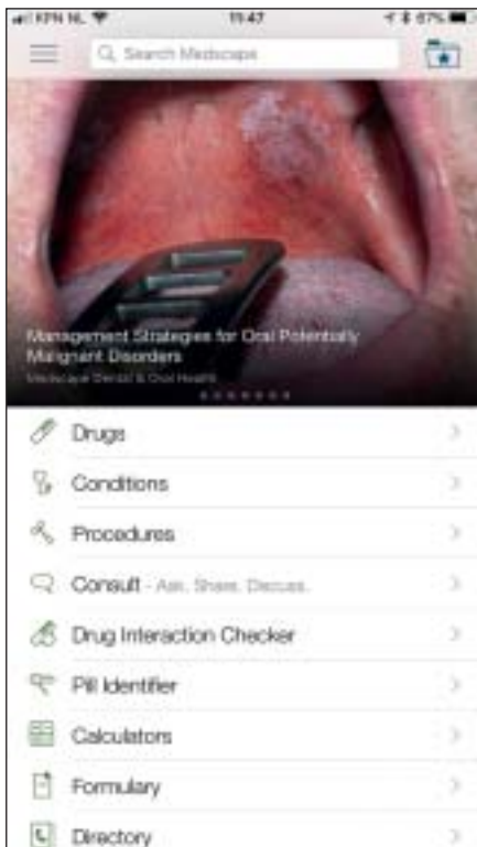
Figuur 1. Verschillende databases.