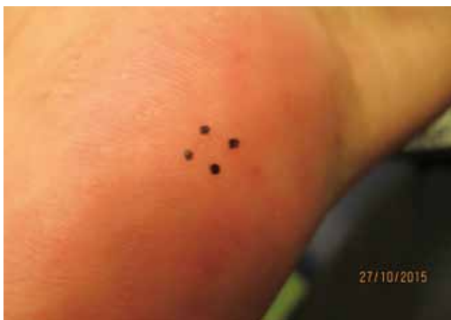
Figuur 2. Detailopname van de rechterhandpalm.