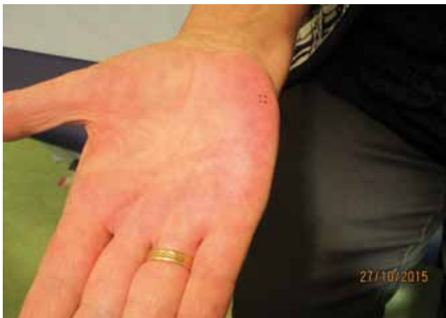
Figuur 1. Lenticulaire erythemateuze papels op rechterhandpalm, deels met annulair aspect.