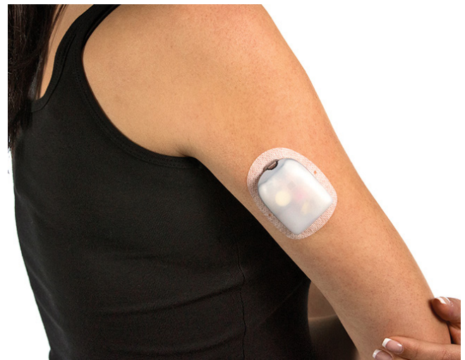
Afbeelding 5 De Omnipod 5 pod (patch pomp).

De hoeveelheid en snelheid van insuline-infusie is gebaseerd op (het beloop van) de glucosewaarden en wordt grotendeels aangestuurd door een algoritme in een app op de monitor, smartphone of pomp. Wel moet de patiënt vaak zelf ook wat gegevens invoeren, bijvoorbeeld over inname van koolhydraten of sporten.