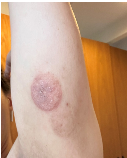
Afbeelding 6 Subacuut eczeem door een glucosesensor, beperkt tot de applicatieplaats van de pleister.

De meeste allergische reacties presenteren zich als subacuut eczeem met (soms heftige) jeuk, erytheem, mild oedeem, papels en schilfering met vrij scherpe begrenzing in de vorm van de pleister van het gebruikte apparaat (afbeelding 6). Acute reacties met erytheem, oedeem, vesikels, natten en erosies zijn zeker niet zeldzaam (afbeelding 1). Bloeden, secundaire infectie, abscessen, littekenvorming, en symptomen als branderigheid en (stekende) pijn zijn ook beschreven. Meestal is de huidafwijking beperkt tot het gebied onder de pleister of er net iets omheen, ook bij de wat heftiger allergische reacties (afbeelding 6), soms breidt het zich wat verder uit (afbeelding 7). Vooral bij allergisch contacteczeem door infusiesystemen (die al na 2-3 dagen verwijderd worden) zijn er vaak verschillende eczeemplekken te zien op de plaatsen van eerdere applicaties (afbeelding 8). Het eczeem geneest binnen een week tot 14 dagen na verwijdering van het apparaat spontaan, soms met tijdelijk postinflammatoire hyper- of hypopigmentatie. [6]