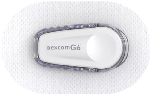
Afbeelding 2. De Dexcom G6 sensor blijft 10 dagen op de huid aanwezig en de pleister moet dus sterke kleefkracht hebben.