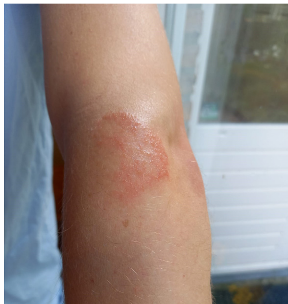
Afbeelding 1. Allergisch contacteczeem veroorzaakt door een glucosesensor.

In dit artikel geven wij een overzicht van de voor de praktiserend dermatoloog belangrijkste aspecten van allergisch