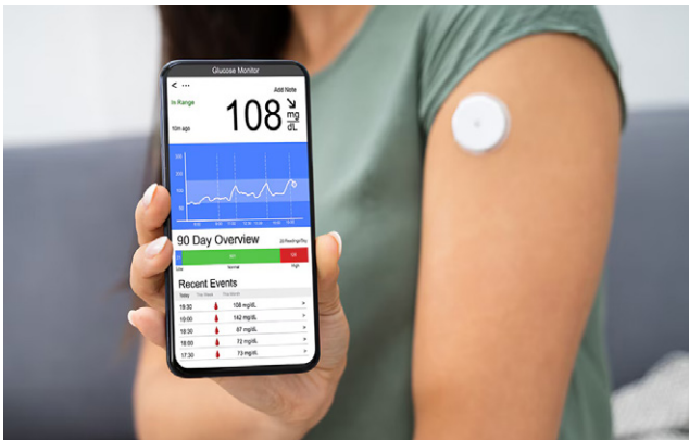
Afbeelding 3 Een sensor meet continu de glucosewaarden in het interstitium en geeft deze via Bluetooth door aan een glucosemonitor.

geven aan een extern apparaat zoals een glucosemonitor, een smartphone, of een insulinepomp (afbeelding 3). De sensoren blijven, afhankelijk van het type, tot maximaal 14 dagen op de huid aanwezig, waarna ze verwijderd worden en een nieuwe sensor elders op de huid wordt aangebracht.