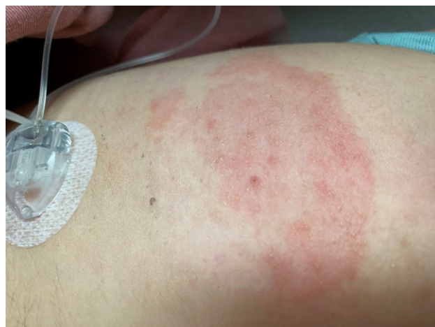
Afbeelding 7 Allergisch contacteczeem door een infusieset. Hier breidde het eczeem zich uit buiten de contactplaats van de pleister.

In totaal zijn tot op heden 18 stoffen beschreven als allergenen in sensoren en pompen/infusiesets, waarvan 10 acrylaten zijn. Verreweg het belangrijkste allergeen in sensoren is (of was) isobornylacrylaat (IBOA), dat door zijn aanwezigheid in de FreeStyle Libre (FSL) 1 sensor verantwoordelijk is geweest voor een 'epidemie' van allergische reacties. Na de ontdekking van IBOA als allergeen in FSL in 2017 zijn in bijna 40 publicaties meer dan 330 allergische patiënten beschreven, met in