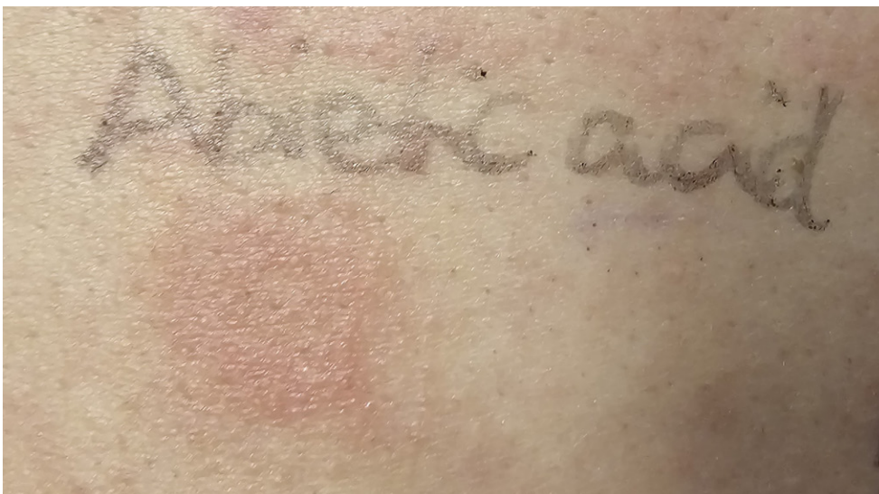
Afbeelding 9 Positieve plakproefreactie op abietic acid (abiëtezuur) bij een patiënte met allergisch contacteczeem door de Dexcom G7 sensor (afbeelding 6). Abietic acid is het hoofbestanddeel van colophonium en bestanddelen daarvan zijn aangetoond in extracten van deze sensor.

Wanneer een patiënt, na een tijdlang een sensor of pomp zonder problemen gedragen te hebben, opeens eczeem ontwikkelt onder de pleister, en er vervolgens eczeem ontstaat na elke nieuwe applicatie, is er bijna zeker sprake van allergisch contacteczeem. Om de diagnose te bevestigen moeten plakproeven (epicutane allergietesten) gedaan worden. [6] Daarbij doemen enkele grote problemen op: nagenoeg altijd is onbekend welke (potentieel) allergene bestanddelen de apparaten bevatten, informatie over het testen van nieuwe allergenen ontbreekt en de allergenen zijn zelden beschikbaar als commerciële preparaten voor plakproeven. Veel fabrikanten tonen een zeer beperkte bereidheid om informatie over de samenstelling van hun producten te delen. Dit alles maakt gericht testen heel moeilijk. De meeste allergenen in senso-