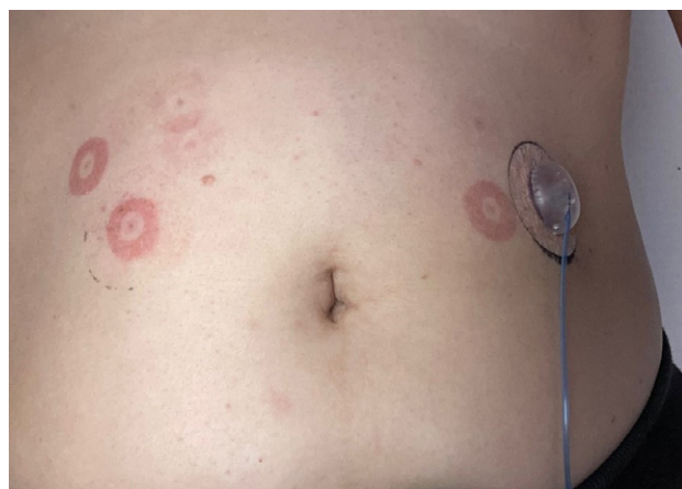
Afbeelding 8 Verschillende eczeemplekken op de plaatsen van eerdere applicaties van de infusieset.

sommige publicaties meer dan 50 gesensibiliseerde patiënten. [1] IBOA was overigens niet aanwezig in de pleister van deze sensor, maar werd gebruikt om de boven- en onderzijde van de plastic behuizing van de sensor aan elkaar te lijmen. Het allergeen migreerde vervolgens spontaan naar de pleister, waar het de patiënten sensibiliseerde en vervolgens allergisch contacteczeem veroorzaakte. Isobornylacrylaat werd ook aangetoond in een aantal andere sensoren en in pompen/infusiesets, waar het eveneens allergische reacties veroorzaakte (zie tabel).