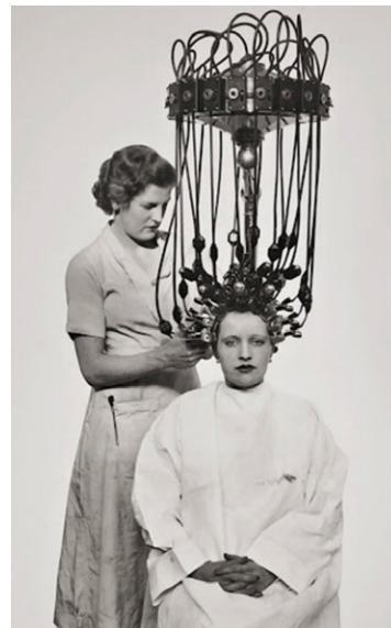
1920: Hot perm machine

De voorloper van de droogkap, de hot comb , de voorloper van de tang en straightener een gladmakende haarlotion, werden alle in de 19 e eeuw uitgevonden. Na de Tweede Wereldoorlog namen de haarstylingsmethoden een vogelvlucht. Van permanent, tot tondeuses en haarkleuringen in alle kleuren van de regenboog. In de 21 e eeuw kwamen daar haarextensions bij. Waren het aanvankelijk veelal de mensen van kleur en vrouwelijke beroemdheden die veel verschillende haarstylingsmethoden toepasten, tegenwoordig sijpelt dit meer en meer door naar de hele bevolking tot aan jonge kinderen toe. [1]