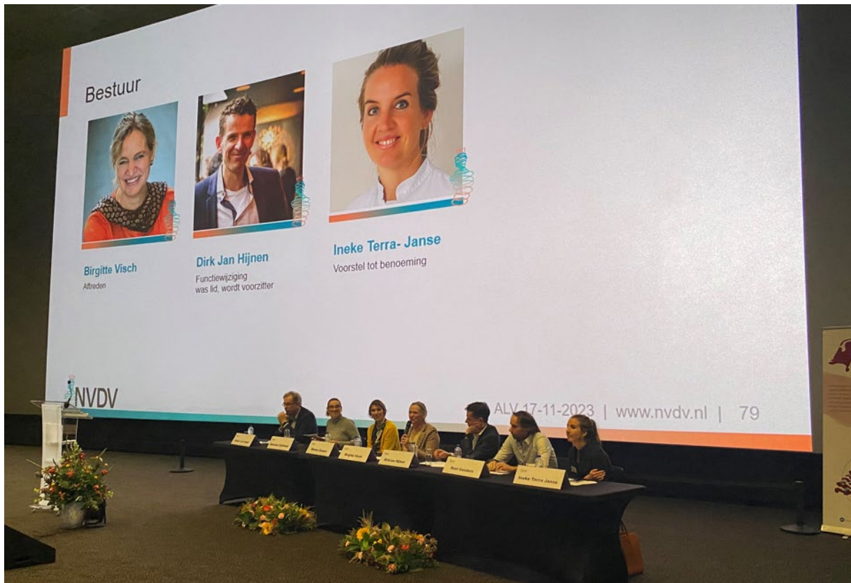
ALV november 2023