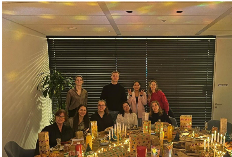
Kerstlunch bureau 2023

Hoewel de stichting al in 2022 werd opgericht, zorgden overheidsmaatregelen ervoor dat er pas in 2023 een bankrekening geopend kon worden. Gedurende deze periode heeft de NVDV tijdelijk de financiële middelen beheerd. Ondanks deze uitdaging, gingen de activiteiten van de stichting onverminderd door.